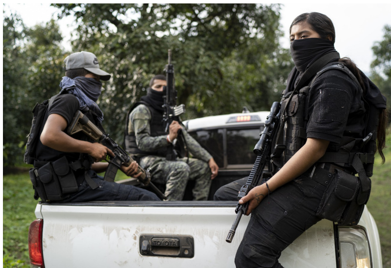
Grupo armado en las huertas de aguacate.

estas fiestas dejaron de realizarse desde que inició la pandemia por Covid-19. Una vez más, la escuela funge como la única presencia estatal y los maestros como burócratas adscritos al Estado que pueden ser cooptados para beneficio privado.