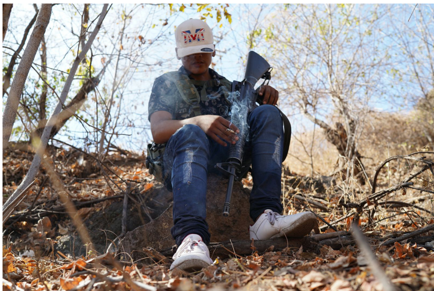
Incorporación de jóvenes en grupos de autodefensa.

Como se ha insistido a lo largo del libro, los mecanismos institucionales para atender el tema se han limitado a inversiones en infraestructura de vigilancia o breves charlas sobre “violencia escolar”, que ignoran estas problemáticas, porque carecen de un diagnóstico sobre lo que se vive en localidades como La Esperanza. Tampoco la SEE ha incorporado asesoría psicológica para apoyar al magisterio o herramientas emocionales que les permitan sobrellevar en el aula situaciones como las descritas. El testimonio de Leco refleja una preocupación generalizada en el magisterio del Valle de Apatzingán. La construcción de paz en las escuelas michoacanas parece aún un proyecto inconcluso frente al aumento de pedagogías de la crueldad. Las opciones para contrarrestar las repercusiones sociales de los mercados ilegales, el reclutamiento en el sicariato y la necropolítica son escasas.