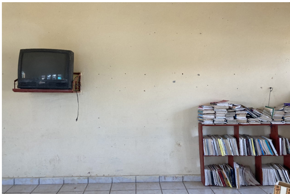
El aula de la escuela telesecundaria de la maestra Macaria.

y un hombre, que atienden en los tres grados, con un aproximado de cuarenta alumnos. La población local, que no supera las 500 personas, está dedicada al trabajo en el campo, según estima la educadora, cerca del 90% de los habitantes acude al corte de limón, monocultivo que ha sido impuesto desde hace veinte años. En esta localidad se asienta un conocido grupo criminal, con comportamientos nada discretos, que la gente local identifica como LV. Macaria relata que los estudiantes se encuentran relacionados de manera íntima con el grupo delincuencia y han sido cooptados en ocasiones para ser “halcones”. Cuando egresan de la telesecundaria, es común que se conviertan en parte del sicariato, así ocurre con muchos de sus ex alumnos varones que se incorporaron a los ejércitos irregulares y, algunos de ellos, murieron o fueron detenidos por la policía. Muchos de ellos cuentan con familiares, padres, tíos o hermanos que han participado en el negocio de las drogas, algunos han sido asesinados y otros están en prisión.