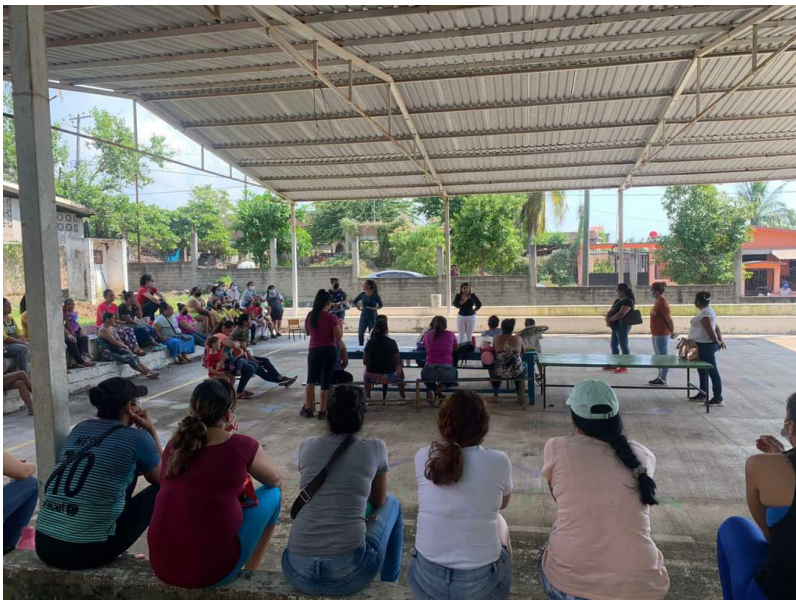
Asamblea entre profesoras y madres de familia en la escuela de El Recreo.

se retiraran de “su comunidad”. Así, la jefa de servicios regionales trató de mediar entre ambos, pero debido al riesgo y la negativa en la comunicación, decidieron concluir la reunión y retirarse. Cuando el “jefe de plaza” observó que estaban a punto de irse, los obligó a subir a sus vehículos e irse de la comunidad, pues básicamente los expulsó. Cuando partieron de El Recreo, una camioneta los escoltó hasta los linderos del pueblo para intimidarlos y asegurarse de su salida rumbo a la ciudad de Lázaro Cárdenas.