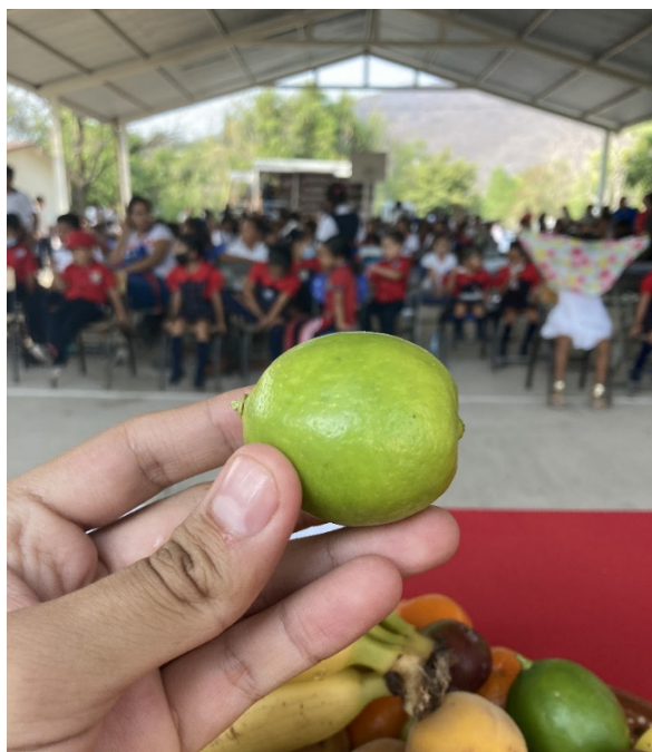
Los limones están presentes en los eventos cívicos escolares.

a la semana por los conflictos derivados entre grupos armados o, en dado caso, por la presencia constante y cercana de personas con armas de fuego. En todos estos eventos, primero fueron alertados por las madres de familia y luego tomaron la determinación de cancelar las actividades escolares. En otras ocasiones, cuando llega la información por WhatsApp de que existen balaceras o bloqueo de caminos con vehículos incendiados, han optado por permanecer dentro de la escuela y esperar a que todos los jóvenes sean recogidos por sus familias. La maestra Noelia menciona que “en la escuela estamos más seguros que afuera donde nos exponemos al querer huir luego luego que empieza el desorden de estas personas” (Noelia, comunicación personal, 20 de mayo del 2022), un aprendizaje que han recuperado a partir de la puesta en práctica de su propio modo de acción ante hechos delictivos, el cual han compartido e informado al alumnado.