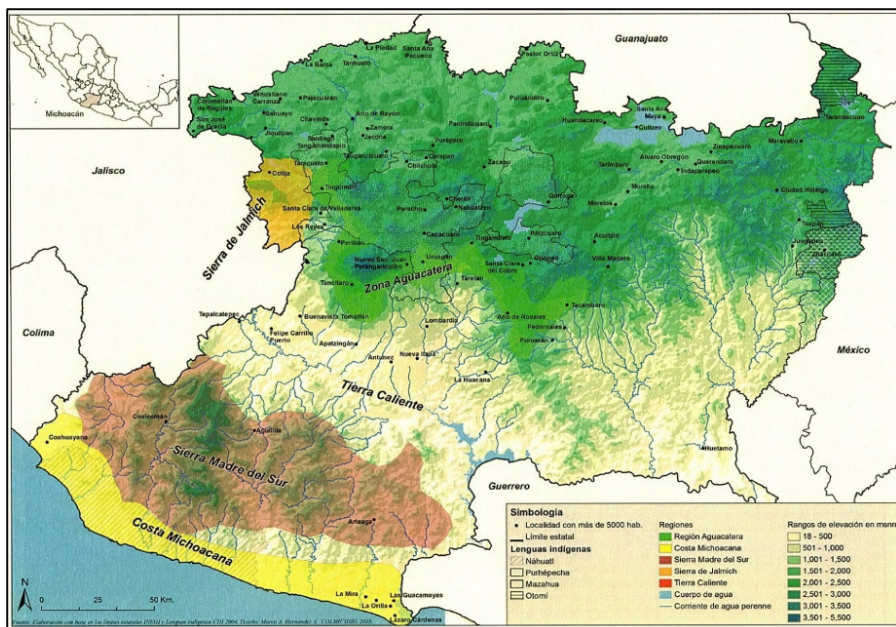
Mapa de regiones de Michoacán, adaptado de La ilusión de la inseguridad. Política y violencia en la periferia michoacana (p. 275), por S. Maldonado, 2018, El Colegio de Michoacán.

En el mapa siguiente es posible observar que en la parte suroeste del estado se encuentra la región de la Tierra Caliente, la Sierra Madre del Sur y la Costa michoacana, en esta última habitan pueblos nahuas, los cuales colindan con los estados de Colima y Jalisco, y en el otro costado, rumbo al puerto de Lázaro Cárdenas con el estado de Guerrero; cerca se encuentra la sierra de Jalmich, en una zona limítrofe entre ambos estados; en la parte central del estado, se encuentra la capital y destaca la amplia zona aguacatera y de berries (principalmente Uruapan, Los Reyes, Tancítaro y Periban), que recorre gran parte de territorio boscoso donde habita el pueblo p'urhépecha, el cual agrupa cuatro micro regiones (la Zona Lacustre, la Meseta, la Cañada de los Once Pueblos y la Ciénega de Zacapu); al oriente de la entidad se encuentra la región otomí y mazahua limita con el Estado de México; y al norte, municipios como Puruándiro o La Piedad cerca del estado de Guanajuato.