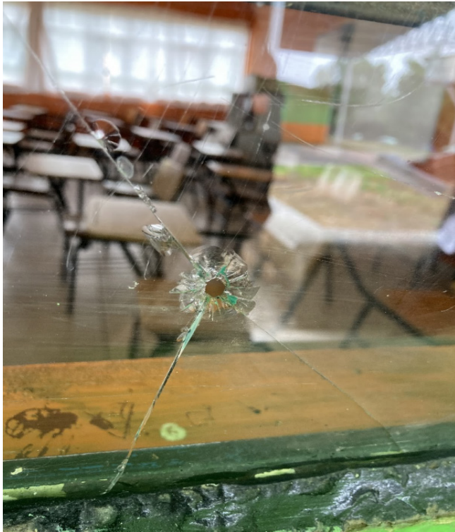
Una ventana de un aula escolar con impacto de arma de fuego.