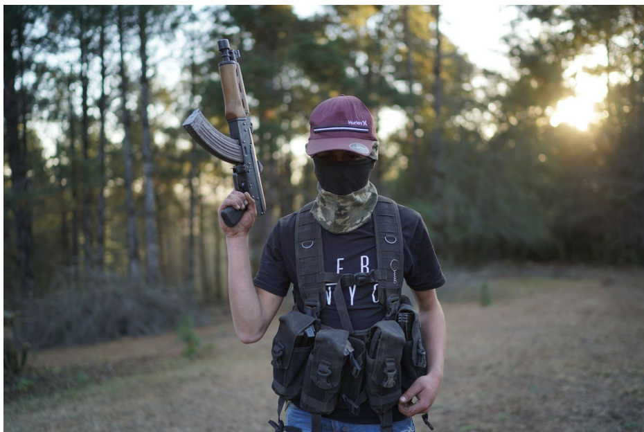
Participación de juventudes en los grupos armados.