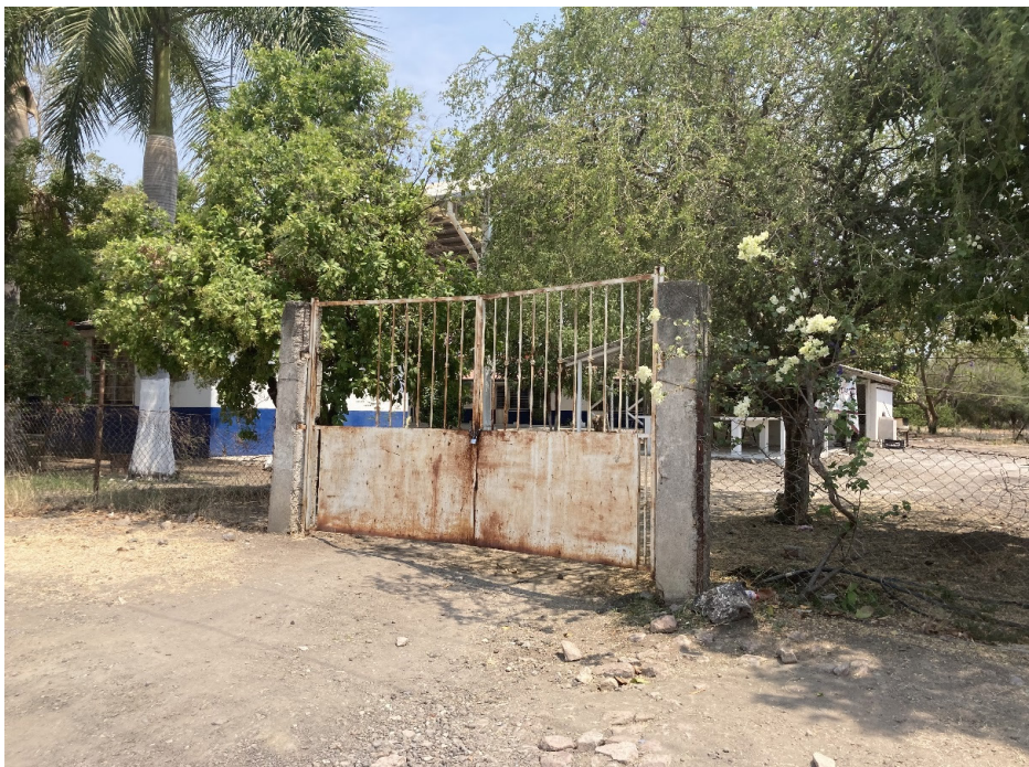
La escuela telesecundaria de La Esperanza. Fotografía propia (2021).

la influencia de los grupos armados y motivar el des-aprendizaje de prácticas agresivas. Esta postura ética se puede interpretar como un giro en las finalidades de la educación, no para cumplir con una serie de estándares de aprendizaje, sino para reforzar el carácter humanitario y de atención a las preocupaciones del propio alumnado, aunque a veces, no se cuentan con los recursos suficientes para trabajar la subjetividad dañada por la violencia.