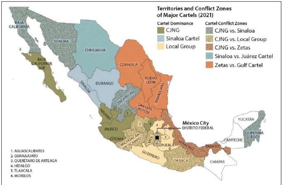
Mapa de zonas de conflicto en México, adaptado de México: Organized Crime and Drug Trafficking Organizations (p. 10), por Congress Research Service, 2022, CRS Reports.