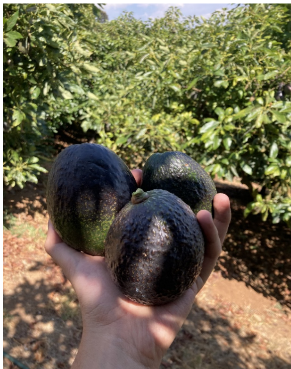
Aguacates de exportación en Uruapan. Fotografía propia (2022).

su alumnado es, particularmente, complicado por dos factores: prevalece el monocultivo de aguacate que atrae la mano de obra barata de jóvenes locales para la recolección del fruto y, por otro lado, abunda el microtráfico de drogas a nivel municipal, principalmente, en los barrios periféricos. Chucho explica que las familias que se relacionan con la escuela donde labora se dedican, casi en su totalidad, a la producción de aguacate. Entre ellos, una porción significativa son jornaleros, quienes muchas veces, están expuestos a los agrotóxicos usados en la fertilización de los campos aguacateros y padecen enfermedades en sus cuerpos similares a las de los habitantes de Nuevo Zirosto, en el mismo municipio (Velázquez, 2019). Mientras que otra parte de la población se ubica como obreros en el rubro de las empresas empaquetadoras.